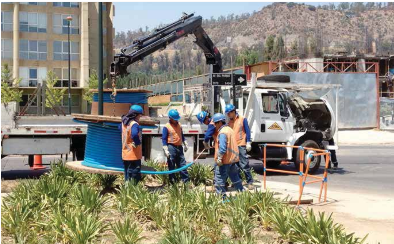
Instalación de un cable XAT en forma subterránea.

Los valores aquí indicados son aproximados y están sujetos a tolerancias de fabricación.